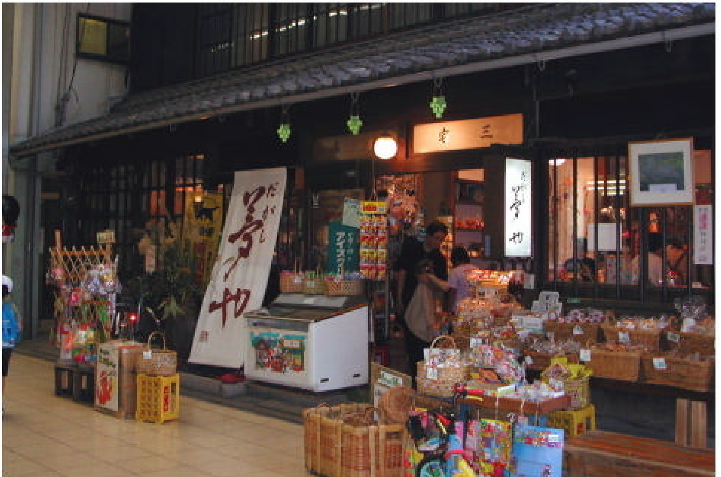
Etape 1 : Trouver un dagashiya

A l'évidence, depuis la fin de l'ère menko aux environs de 1965, les dagashiya ne se fournissent plus en « nouveaux » menko, mais croyez le ou non, certains possèdent encore des stocks d'invendus vieux de soixante ans qui traînent toujours ça et là et sont à vendre. En général, ils sont dans un coin d'un magasin de stockage ou dans un coin du magasin où personne ne va jamais regarder. Ce sont les meilleures trouvailles et les propriétaires sont en général très heureux de se débarrasser de ces menko à un prix raisonnable. Trouver un dagashiya est un vrai défi, mais c'est faisable. Renseignez vous avez quelques gars du coin et demandez leur le dagashiya le plus proche, ou baladez vous dans les vieux quartiers de la ville et il est certain que vous tombiez sur l'un d'entre eux.