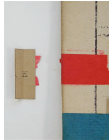
Etape 5 : Récupérer son lot