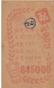
Foto 4: Ejemplos de sellos ganadores de la parte trasera de un menko