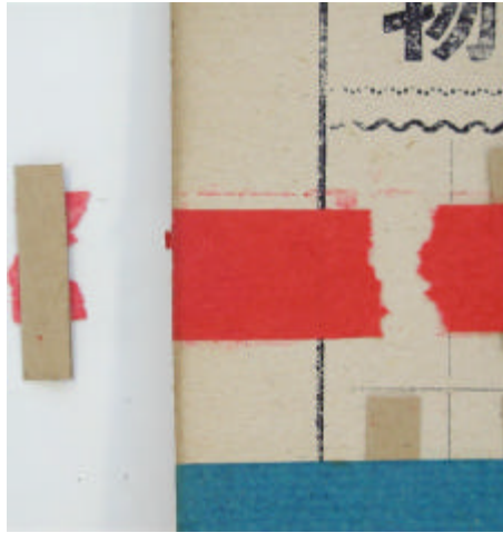
Paso 4: Tirar