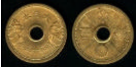
Paso 3: Pagar 5 sen